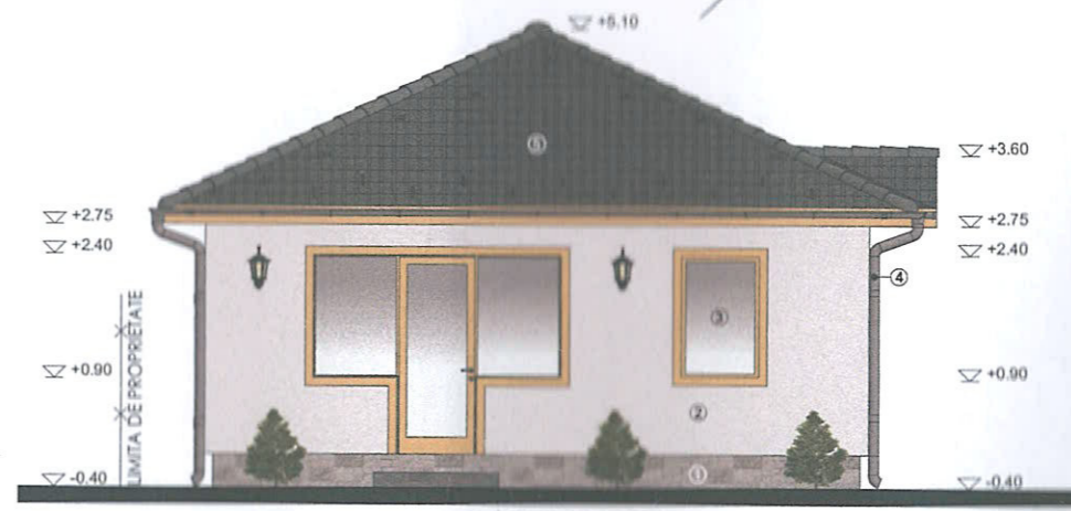
FATADA LATERALA STANGA