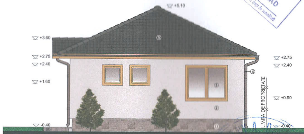
FATADA LATERALA DREAPTA