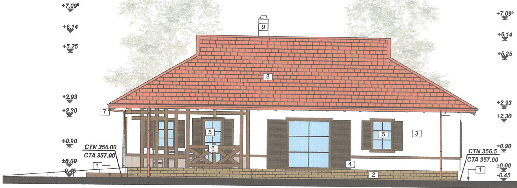
FATADA LATERALA DREAPTA SC 1 : 100